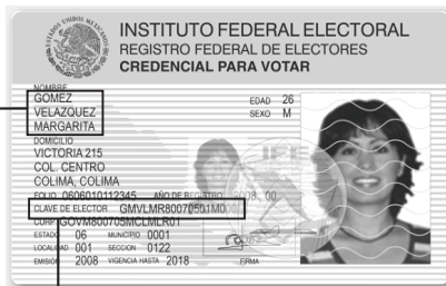
Anverso de la credencial modelos anteriores