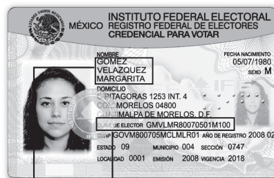
Anverso del nuevo modelo de la credencial